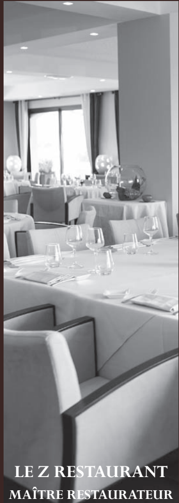
LE Z RESTAURANT MAÎTRE RESTAURATEUR