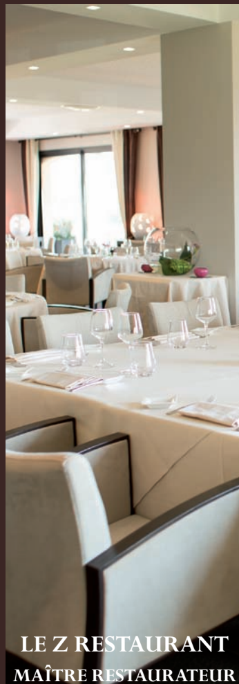
LE Z RESTAURANT MAÎTRE RESTAURATEUR