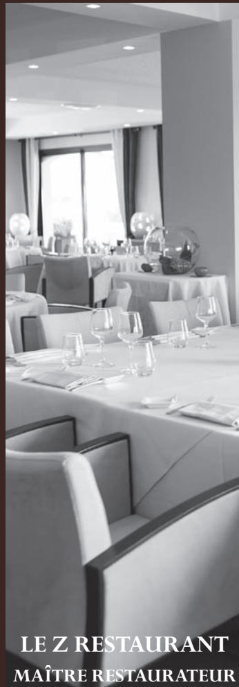
LE Z RESTAURANT MAÎTRE RESTAURATEUR